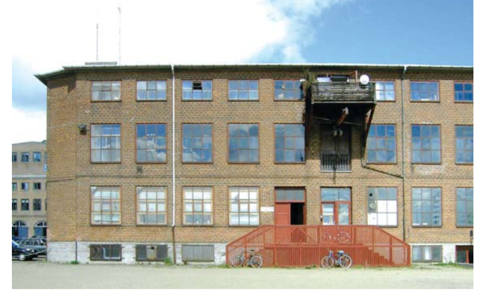
Byggnad 12 med sin vackert komponerade fasad, lägg märke till den låga övervåningen.