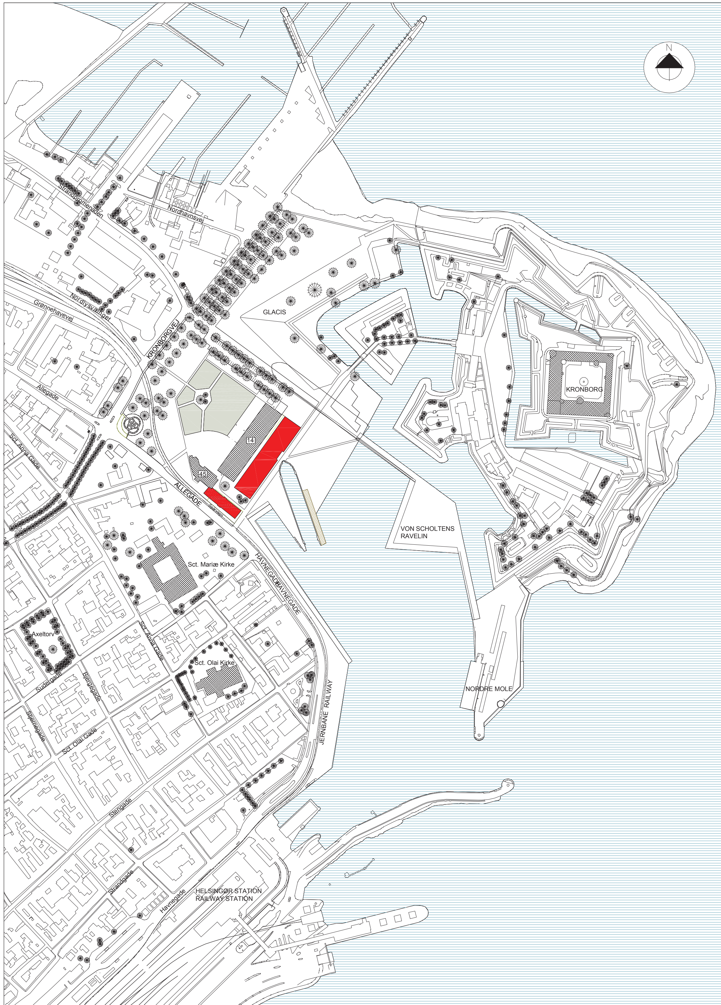
Situationsplan framtid, 1:3000