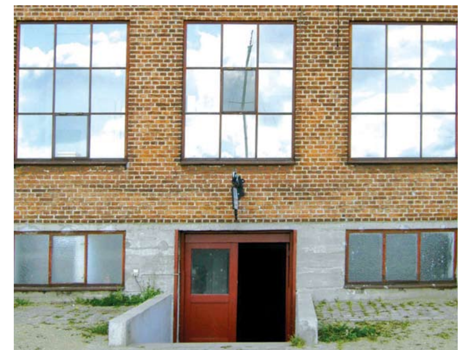
Vackert handslaget tegel i fasaden på byggnad 12. Även de befintliga fönstren med sina tunna profiler och bågar är värda att bevara.

Byggnad 12 o 13 sammanfogas med den nya huvudentrén som förlängs hit. Detta blir knutpunkten eller navet kring vilket biblioteket, teatern och caféet samlas.