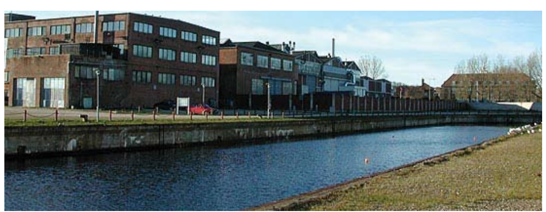
Ett nytt nationellt Handels- och Sjöfartsmuseum blir den första kulturinstitutionen i området utöver etapp ett. Museet förväntas nyttja den norra dockans samlade grundareal på 3300 m 2 och djup på knappt 7 m med utställningsrum i olika nivåer. Dockan förväntas övertäckas på låg höjd med hänsyn till Kronborgs försvarsanläggning. Museet som nu är inhytt i Kronborgs slott har ca 45 000 besökare årligen, en siffra som beräknas stiga markant i samband med nybyggnaden.

Enligt planerna för landskapsprojektet byggs kajen om längs Havnegade: dels breddas kajen för kunna ta emot större fartyg, dels byggs ett försänt trädäck längs kajen. Detta blir Helsingörs nya strandpromenad och den vackraste vägen till kulturområdet för fotgängare som anländer med tåg eller färja. Längs bibliotekets fasad mot vattnet löper samtidigt huvudstråket för fotgängare mellan staden och Kronborgs slott.