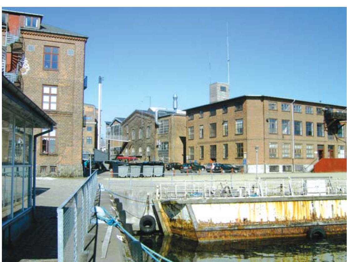
Platsen mellan byggnad 10 och 12 med byggnad 14 i fonden, här blir den entrén till Kulturvarvets etapp 2.