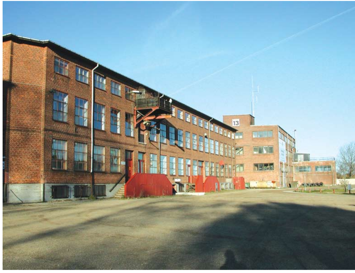
Byggnad 12 med byggnad 13 i fonden.