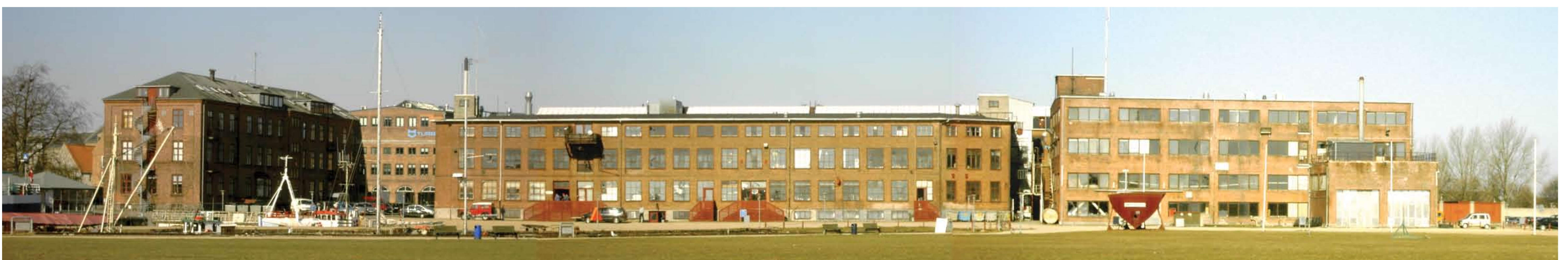
Byggnad 10, behålls och byggs om invändigt